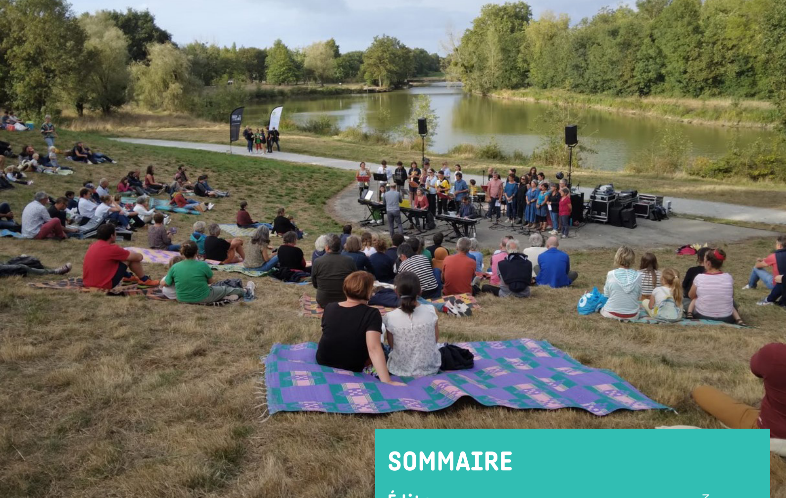
Saffré - Le bout de bois © Anne-Claire Savin