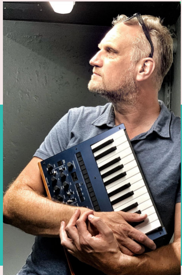
Guillaume Hazebrouck © RBKRECORDS

Une musique à la fois populaire et savante, exigeante et accessible, qui s'adresse à toutes et tous !